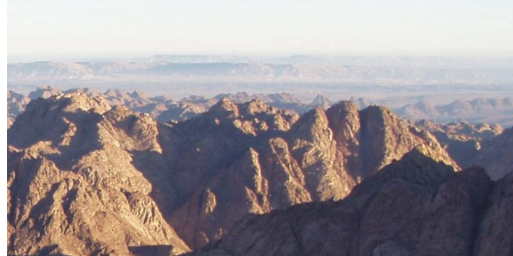
Text a foto: Zdena Schliegsbirová